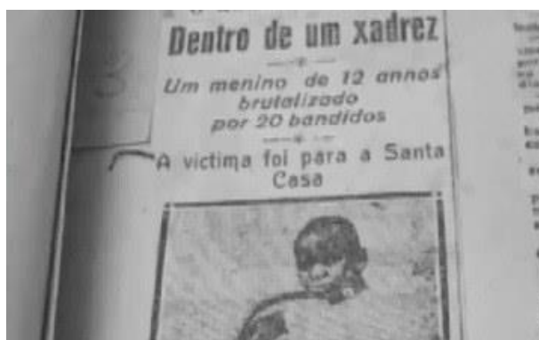
Figura 3. Recorte do jornal O Globo .