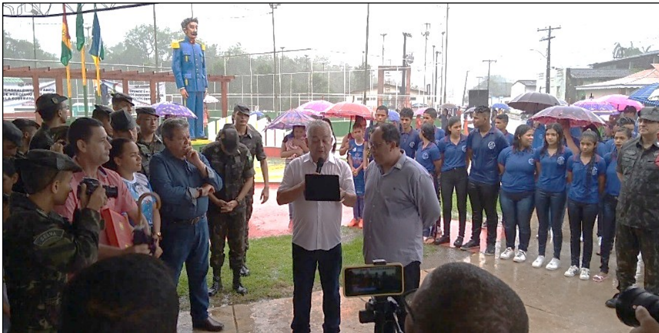
Figura 6 — Autoridades discursando no Dia de Cabralzinho no município de Amapá/AP