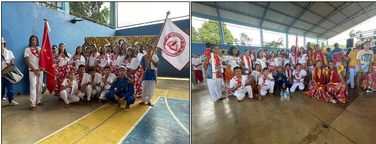
Figura 2 — Grupo de alunos participando do projeto “Marabaixo nas Escolas” em 2024