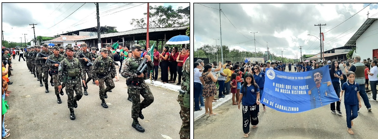
Figura 4 — Desfile do Exército brasileiro e comunidade local no município de Amapá/AP