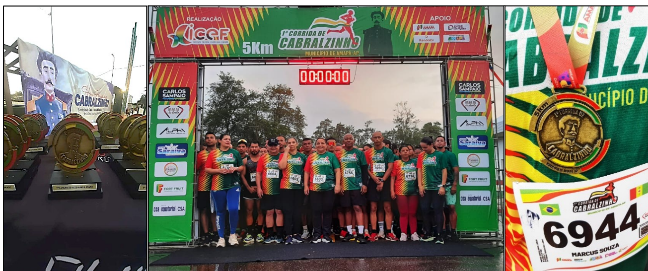
Figura 5 — Medalhas, troféus e participantes da corrida de Cabralzinho em Amapá/AP