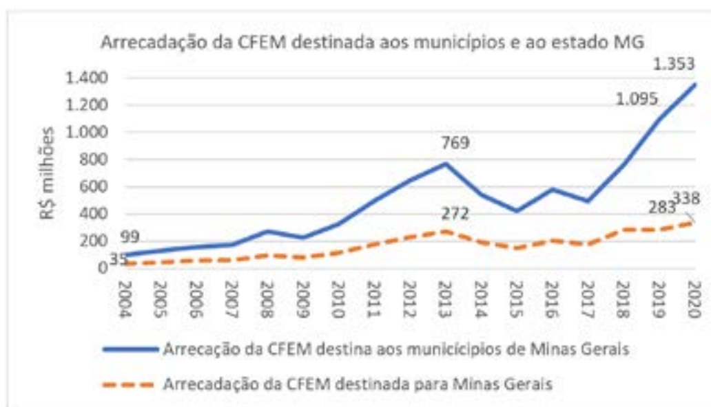
Gráfico 1. Arrecadação da CFEM municípios e estado de Minas Gerais 2004*-2020.

A evolução dessas arrecadações pode ser observada no Gráfico 1, tanto para os municípios quanto para o estado de Minas Gerais: