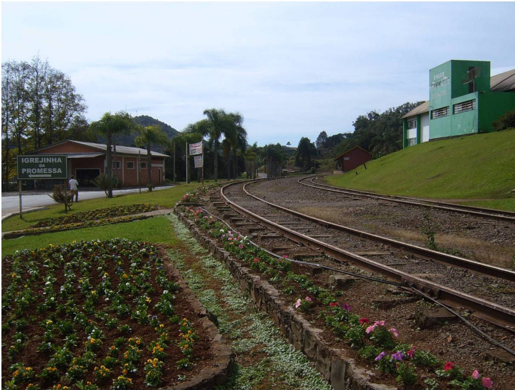
Figura 2: Centro do município de Pinheiro Preto - SC, marcado pela estrada de Ferro utilizada na Guerra do Contestado

Nesse sentido, evidencia-se uma ausência, nos habitantes, de uma identidade, ligada à história do espaço onde a cidade e a sua sociedade se instituem. Esta ausência é expressa por meio do museu e dos folhetos turísticos, que relatam um passado cheio de lacunas.