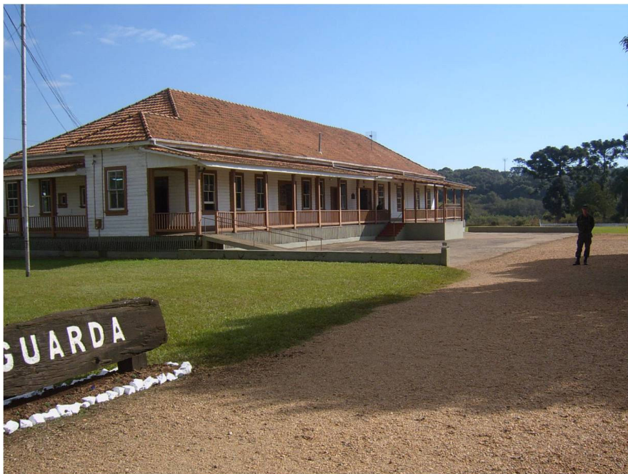
Figura 3: Company Town da Southern Brazil Lumber and Colonization Company , hoje Centro de Instrução Marechal Hermes. Três Barras – SC

Outra situação peculiar se encontra entre Porto União (SC) e União da Vitória (PR), onde duas cidades possuem a história advinda de uma só – até a Guerra do Contestado “Porto União da Vitória”. Suas localizações vão marcar as especificidades regionais, pois se encontram exatamente no divisor territorial entre os estados do Paraná e de Santa Catarina. Para este caso, a Estrada de Ferro teve o papel fundamental na constituição do ambiente urbano atual, já que, a linha ferroviária figura, até hoje, o corte entre os dois Estados, curiosamente localizados no centro das cidades.