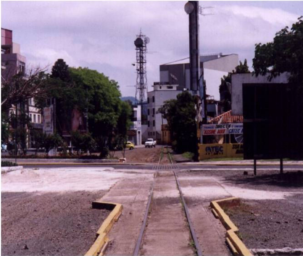
Figura 4: Centro e limite municipal de Porto União - SC e de União da Vitória – PR

significado é sinônimo de delimitação por parte do poder político-administrativo do Estado, como pelo conceito atrelado a identidade, pois, existem duas cidades, conurbadas entre si, mas formadoras de uma única noção de identidade – mesmo considerando que as cidades gêmeas formem uma urbanização de menos de 100 mil habitantes, portanto, cidades pequenas (figura 4).