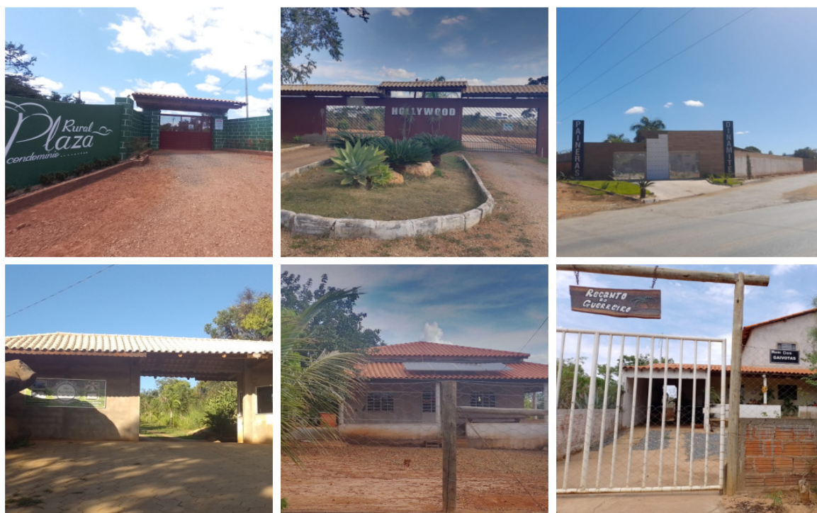
Figura 3 - Chácaras rurais espaços multifuncionais para aluguel, moradia ou lazer

O mosaico de fotos (Figura 3) retrata a nova configuração do espaço rural em Montes Claros característica do continuum rural-urbano, respectivamente, têm-se: Condomínios com chácaras individuais: Condomínio Rural Plaza localizado às margens da MG-308, Condomínio Hollywood MG-308, chácara para aluguel LMG-657, Chácara para aluguel BR-135, Chácara moradia (Chacreamento Jardins do Lago) BR-135, Chácara moradia (Chacreamento Recanto da Serra) BR-135.