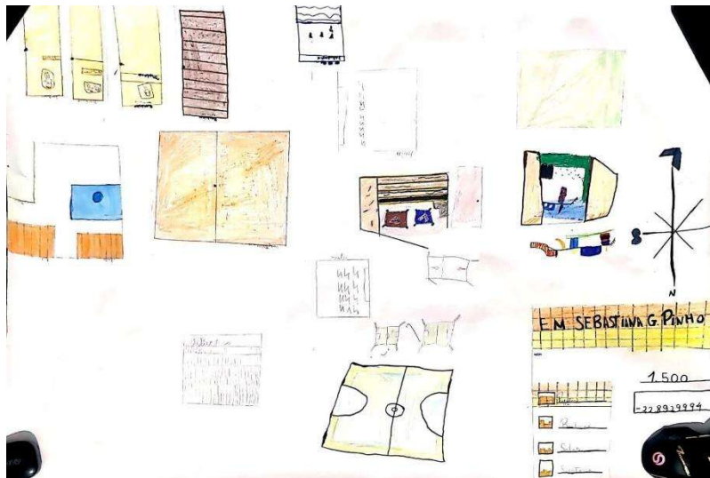
Figura 2 - Mapa da Escola Sebastiana Gonçalves Pinho