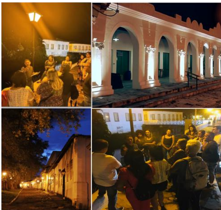
Figura 3. Trabalho de campo noturno na Cidade de Goiás / GO.

O presente estudo caracteriza-se como uma pesquisa de natureza qualitativa, estruturada a partir de um relato de experiência 3 (Grollmus; Tarrés, 2015) desenvolvido durante um trabalho de campo noturno realizado em junho de 2023 (figura 3), no âmbito da disciplina Tópicos de Geodiversidade, do curso de Mestrado em Geografia da Universidade Estadual de Goiás (UEG), Campus Cora Coralina, Cidade de Goiás / GO.