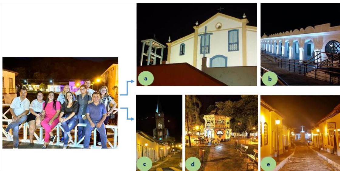
a- Igreja de São Francisco de Paula; b- Mercado Municipal; c- rua de acesso à Igreja de Nossa Senhora do Rosário; d- Praça do Coreto; e- rua de acesso ao monumento da Cruz de Anhanguera. Figura 5. Equipe em trabalho de campo nas ruas empedradas do centro histórico da Cidade de Goiás / GO.

Trata-se de um relato de experiência fundamentado pela metodologia qualitativa, utilizando procedimentos de observação direta, registros fotográficos e anotações em caderno de campo durante trabalho de campo noturno ao longo do lado esquerdo da avenida Sebastião Fleury Curado, que margeia o rio Vermelho (figura 5).