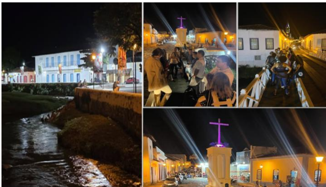
Figura 4. Trabalho de campo noturno ao longo do rio Vermelho na Cidade de Goiás / GO.

O trabalho de campo 8 (Carneiro, 2009; Lacoste, 2006) foi conduzido pelos docentes responsáveis pela disciplina e estruturado a partir de paradas estratégicas no centro histórico da Cidade de Goiás, permitindo a análise integrada de elementos naturais e construídos. O percurso empírico incluiu: (a) a ponte do rio Vermelho, nas proximidades da Casa de Cora Coralina; (b) a margem esquerda do rio Vermelho ao longo da avenida Sebastião Fleury Curado; (c) as cercanias da Igreja de São Francisco de Paula.