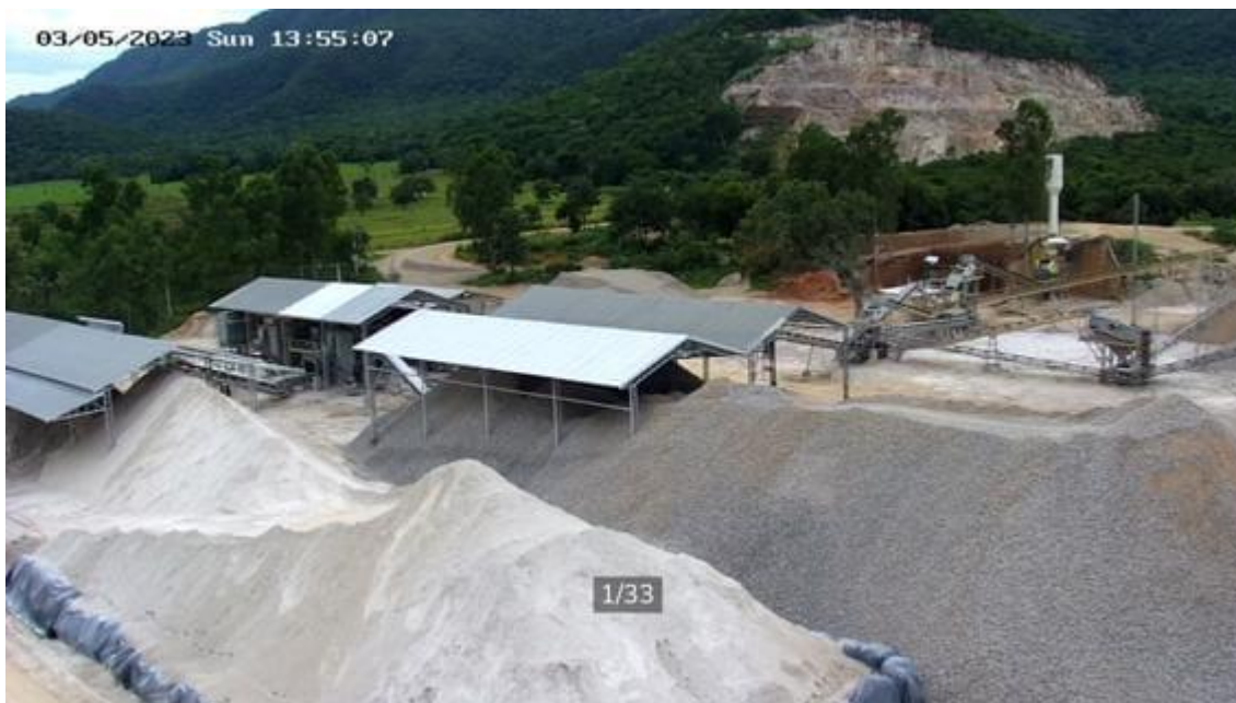
Figura 3 – Empresa Calcário RP/RS, no município de Porto Estrela – MT.

intensificando os fluxos econômicos e de transporte entre Porto Estrela e municípios vizinhos. Essa atividade não apenas gera empregos locais, mas também insere o município em uma rede regional de produção e circulação, vinculando-o às demandas da agroindústria mato-grossense.