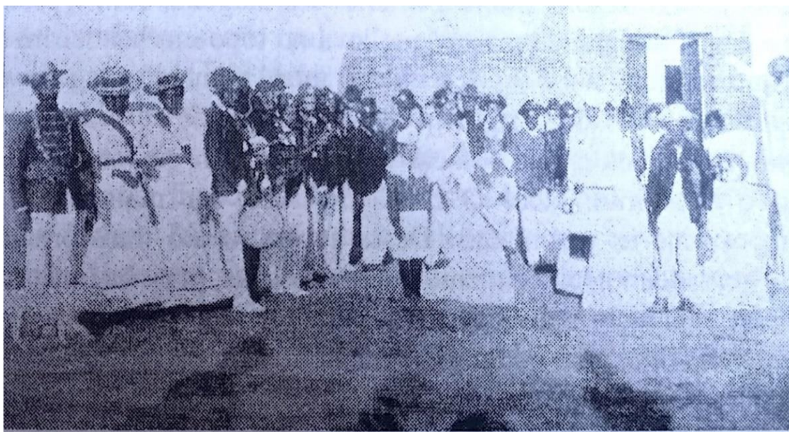
Figura 6 — Bumba Meu Boi - Desfile de negros em Jaguarão (1903)

Nota. De Três anos no Brasil: Thomas Aquinas Schoenaers, missionário premonstratense no Rio Grande do Sul (p. 329), por T. A. Schoenaers, 2003, EDUCAT.