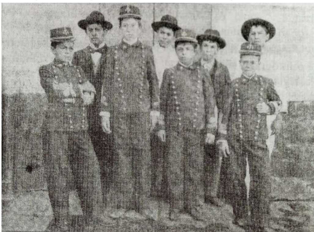
Figura 2 – Fotografia de alunos do internato do Colégio Espírito Santo

Nota. De Três anos no Brasil: Thomas Aquinas Schoenaers, missionário premonstratense no Rio Grande do Sul (p. 260), por T. A. Schoenaers, 2003, EDUCAT.