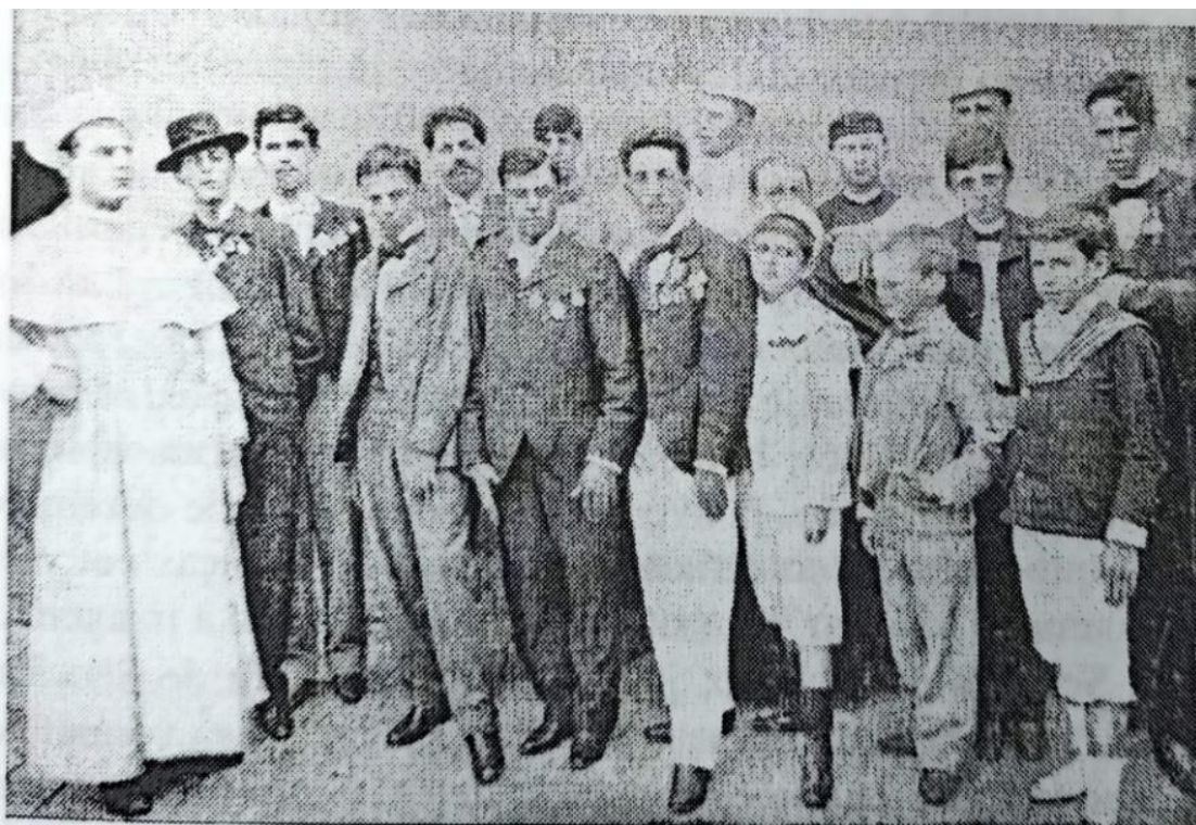
Figura 5 – Grupo de alunos do teatro do Colégio, com professores (1901)

Nota. De Três anos no Brasil: Thomas Aquinas Schoenaers, missionário premonstratense no Rio Grande do Sul (p. 197), por T. A. Schoenaers, 2003, EDUCAT.