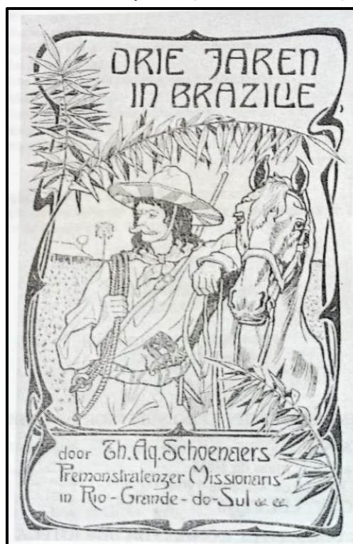
Figura 1 – Capa da edição original em Flamengo, de 1904

Nota. De Três anos no Brasil: Thomas Aquinas Schoenaers, missionário premonstratense no Rio Grande do Sul (p. 6), por T. A. Schoenaers, 2003, EDUCAT.