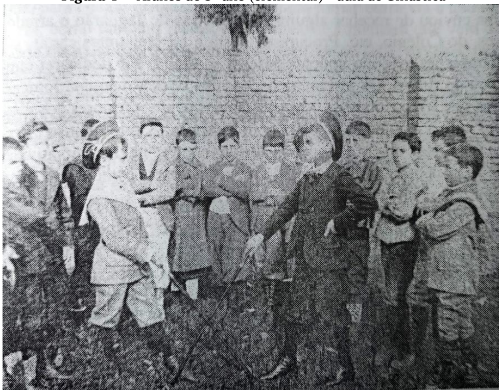
Figura 4 — Alunos do 3º ano (elementar) - aula de Ginástica

Nota. De Três anos no Brasil: Thomas Aquinas Schoenaers, missionário premonstratense no Rio Grande do Sul (p. 161), por T. A. Schoenaers, 2003, EDUCAT.